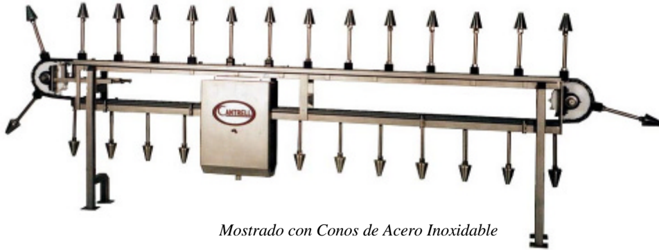
Mostrado con Conos de Acero Inoxidable

El Sistema de Desguezado de Conos modelo no. HBC-110-KC Cantrell es una versión mejorada del sistema en uso ya establecido a través de la industria en existencia. Las ventajas del HCB-110-KC incluyen el extendimiento de la vida de la cadena pues no tiene movimiento en el acero inoxidable en el polymer.