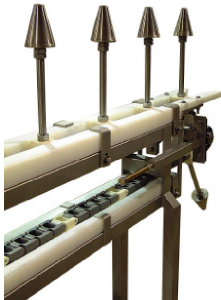
Mostrado con Conos de Acero Inoxidable

El diseño unico de los conos permite que la mitad del avé ó el avé completa desguezada de, parrilla, asado y pavos. Puede ser diseñado de acuerdo a las especificaciones del cliente, para cualquier operación y la existencia de otros transportadores para crear un sistema completo.